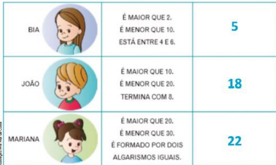
Ilustração: Ana Rita da Costa